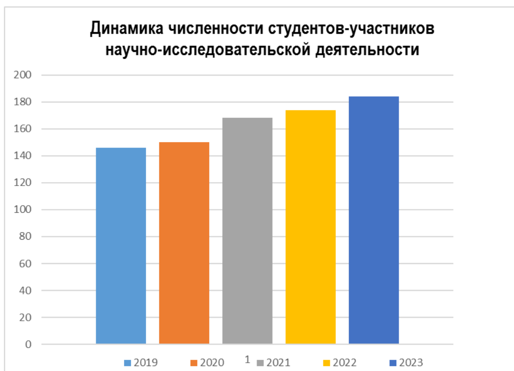
Рис. 3. Динамика численности студентов-участников научно-исследовательской деятельности

Одной из форм научно-исследовательской деятельности студентов Института являются студенческие научные кружки, работа которых направлена на формирование научного потенциала и навыка научно-исследовательской работы в свободное от учебы время. Анализ роста количества студентов, принимающих участие в НИРС, за последние пять лет показывает его активный прирост.