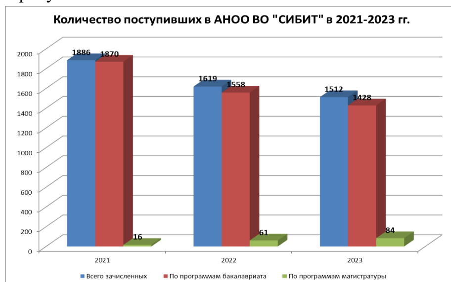
Рис. 2. Количество поступивших в АНОО ВО «СИБИТ» в 2021-2023 гг.

Сравнительный анализ количества зачисленных в 2021, 2022, 2023 гг. представлен на рисунке 2.